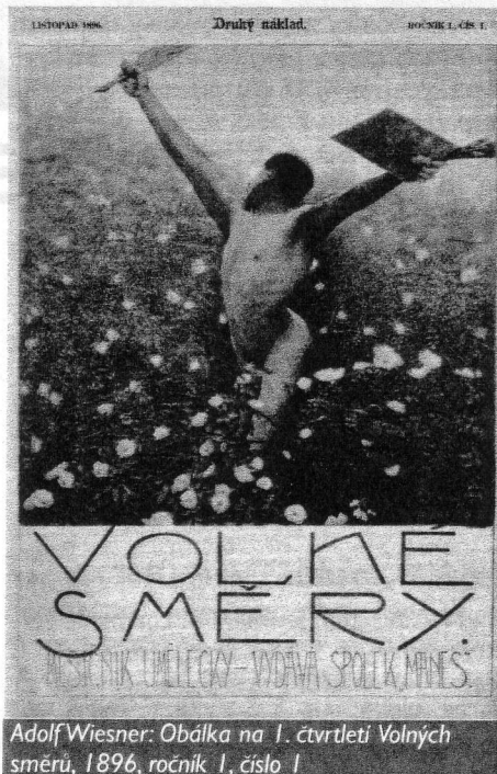
Adolf Wiesner: Obálka na 1. čtvrtletí Volných směrů, 1896, ročník I, číslo I

V Americe vystudoval Jan White architekturu a specializoval se na design. Nastoupil do novin a celý život se věnoval grafické podobě časopisů. National Geographic, Golf Digest a další prestižní tituly patří k těm, jejichž grafickou podobu určil. Přednáší po celém světě. Proč? Jako jeden z mála odborníků umí logicky vysvětlit, jak má určitý časopis vypadat. Ne sdělit pocity typu líbí-nelíbí, ale přesně popsat řešení problému.