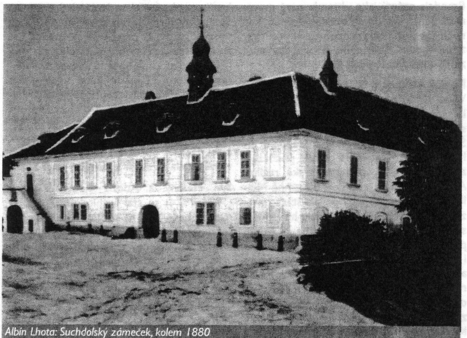
Albín Lhota: Suchdolský zámek, kolem 1880

text: Alena Sojková